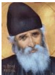
Sfântul Cuvios Paisie Aghioritul (†1994)

Gust amar are înșelarea (1Ioan 3, 7). Dorind să faci binele, îți dai seama că ai greșit. Intenția bună nu este suficientă pentru a merge drept pe calea mântuirii. Totuși Dumnezeu cunoaște inima omului și îi vine în ajutor. Totul este ca omul să se smerească înaintea lui Dumnezeu și înaintea oamenilor. Cum ne smerim, cum vine peste noi harul Duhului Sfânt. Harul dumnezeiesc ne luminează și ne înțelegem greșelile, apoi primim putere să ne pocăim și să ne îndreptăm.