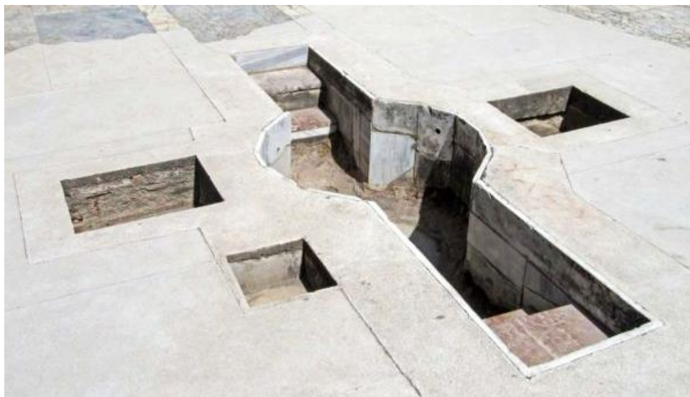
(mormântul Sfântului Apostol și Evanghelist Ioan din Efes, Turcia)

Orice om poate privi și pipăi aceste dovezi, numai să vrea. Ortodoxia este calea mântuirii, este viața cea adevărată în Hristos, este slava lui Dumnezeu, pe pământ dar și în ceruri. Ea, Biserica Ortodoxă are misiunea de a duce Evanghelia până la marginile pământului (Fapte 1,8).