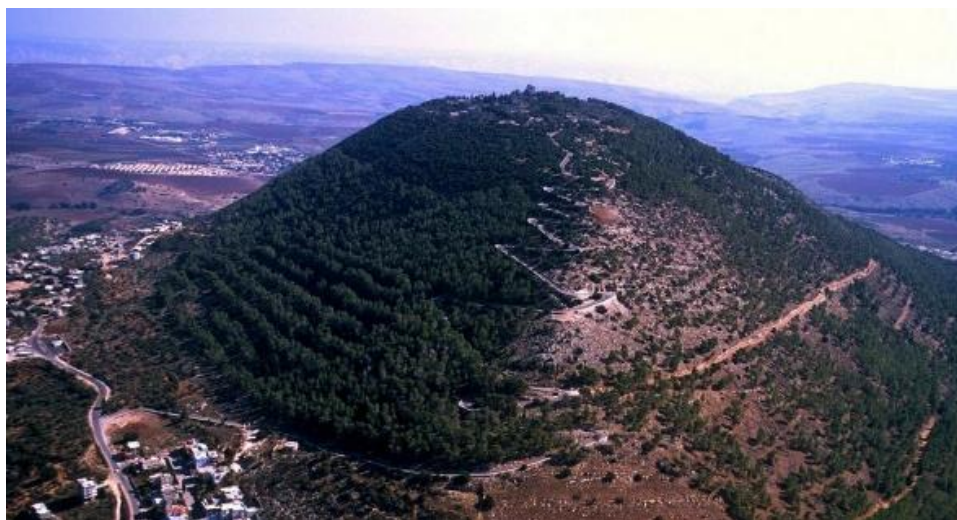
Muntele Tabor din Israel

Ceață nu poate fi, fiindcă ceața nu poate apărea în aerul uscat al zonei și la o astfel de temperatură (peste 40 de grade Celsius), spun meteorologii. Apoi norul de binecuvântare care coboară apare numai în zona mănăstirii ortodoxe. Norul îi înconjoară pe credincioși și apare deasupra crucii Bisericii Schimbării la Față, crescând în dimensiuni.